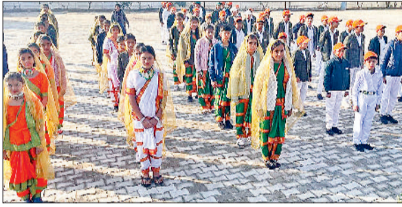
नारनौल। सांस्कृतिक कार्यक्रम प्रस्तुत करने वाले बच्चे।