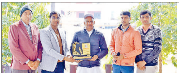
नारनौल। मुख्य अतिथि को स्मृति चिह्न भेंट करते हुए।