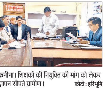
कनीना। शिक्षकों की नियुक्ति की मांग को लेकर ज्ञापन सौंपते ग्रामीण।