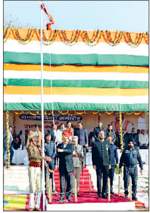
नारनौल। जिला स्तरीय गणतंत्र दिवस समारोह में राष्ट्रीय ध्वज फहराते उद्योग एवं वाणिज्य मंत्री राव नरबीर सिंह। व गणतंत्र दिवस समारोह में सांस्कृतिक का कार्यक्रम पेश करते स्कूली बच्चे।

जिले में 77वां गणतंत्र दिवस समारोह गरिमापूर्ण तरीके से व धूमधाम से मनाया गया। आईटीआई मैदान में आयोजित जिला स्तरीय कार्यक्रम में उद्योग एवं वाणिज्य मंत्री राव नरबीर सिंह ने राष्ट्रीय ध्वज फहराया। वहीं परेड का निरीक्षण किया तथा मार्च पास्ट की सलामी ली। विभिन्न स्कूली बच्चों ने देशभक्ति से ओतप्रोत सांस्कृतिक कार्यक्रम पेश किए तथा पीटी व डबल लोजियम शो का प्रदर्शन किया। 16 विभागों ने सरकार की जनकल्याणकारी योजनाओं से संबंधित मनमोहक झांकियां प्रदर्शित की।