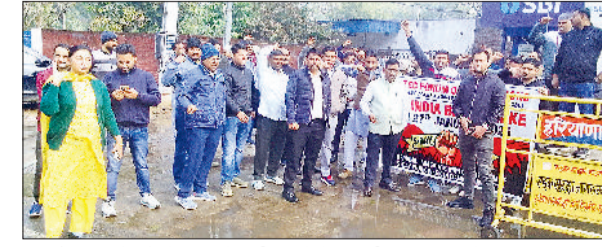
नारनौल। मांगों को लेकर नारेबाजी करते बैंक कर्मों व हड़ताल के प्रारण सुनसान बैंक।

रिजर्व बैंक के अधीन आने वाले सरकारी बैंकों में मंगलवार को सप्ताह में पांच दिवसीय कार्य की मांग को लेकर हड़ताल रही। जिसका असर जिले में देखने को मिला। हड़ताल के चलते जिलेपर के सभी सरकारी बैंक बंद रहे, जिससे किसी भी प्रकार का कोई लेनदेन नहीं हो सका। इस दौरान बैंक परिसर सुनसान रहे तथा बैंक कर्मचारियों व अधिकारियों ने मांगों को लेकर नारेबाजी कर रहे जताया। बता दें कि बैंकों की हड़ताल के