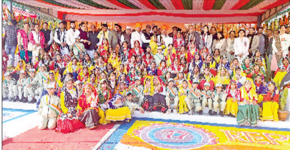
नांगल चौधरी। सांस्कृतिक कार्यक्रमों की प्रस्तुति देते विद्यार्थी।