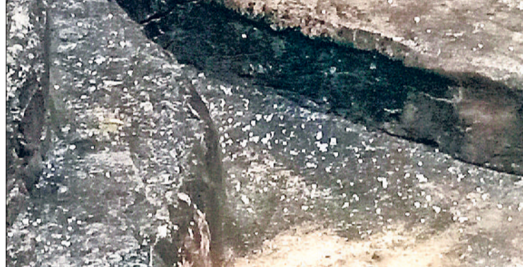
नारनौल। शहर में गिरे ओले।

मौसम में आए बदलाव के कारण जिले में रात्रि तापमान में हल्की बढ़त, जबकि दिन के तापमान में हल्की गिरावट देखने को मिली